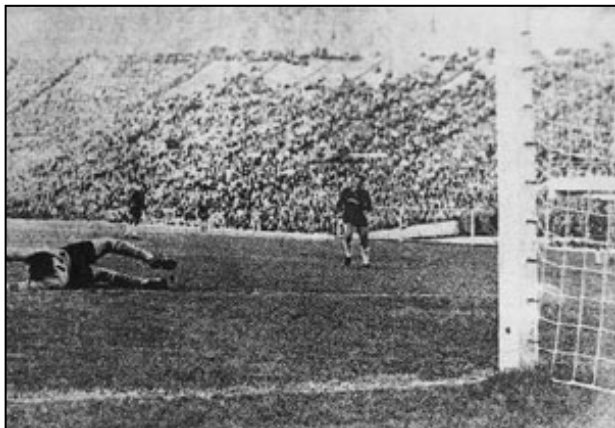
La televisión en Chile comenzó a expandirse comercialmente para el Mundial de Fútbol que se realizó en nuestro país en 1962.

La historia de la televisión en Chile se remonta a mediados de la década del '50. Nace como la extensión de las investigaciones iniciadas en los departamentos de ingeniería de las Universidades de Chile, Universidad Católica y Universidad Católica de Valparaíso, quienes fabricaron los primeros equipos y transmisores con estudiantes y profesores, principalmente provenientes de los departamentos de física, electrónica y electricidad. La primera transmisión de televisión ocurrió el 6 de octubre de 1957 .