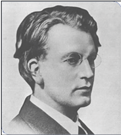
John Logie Baird inventó un sistema de televisión que incorporaba los rayos infrarrojos para captar imágenes en la oscuridad.

Las primeras transmisiones experimentales nacieron a la vida en U.S.A. Fue en julio de 1928 cuando desde la estación experimental W3XK de Washington, JENKINS comenzó a transmitir imágenes exploradas principalmente de películas con cierta regularidad y con una definición de 48 líneas.