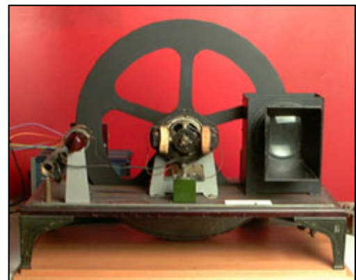
Disco de exploración lumínica, más conocido como disco de Nipkow.

Los primeros dispositivos realmente satisfactorios para captar imágenes fueron el iconoscopio , que fue inventado por el físico estadounidense de origen ruso Vladimir Kosma Zworykin en 1923 , y el tubo disector de imágenes , inventado por el ingeniero de radio estadounidense Philo Taylor Farnsworth poco tiempo después.