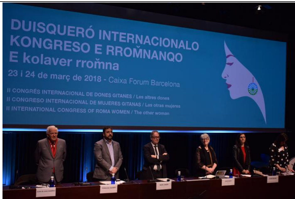
Taula inaugural del II Congrés Internación de Dones Gitanes

Enguany les participants han vingut d'Itàlia, Hongria, Regne Unit, Sèrbia, Albània, França, Macedònia, Grècia, Romania, Portugal, República Txeca, Alemanya, Suècia, Moldàvia, Brasil i la resta de l'estat espanyol. La participació ha estat tot un èxit, no sols pel nombre de participants, sinó pel gran recolzament rebut per la societat, i és que han col·laborat en l'organització del congrés més de 30 voluntaris gitanos i no gitanos. Per facilitar el màxim nombre de participants, també s'ha comptat amb un espai infantil pels fills i filles petites de les dones gitanes. Una altra mostra de l'impacte del congrés és que va reunir a dones gitanes que en la seva majoria eren gitanes de base, es a dir, dones sense estudis acadèmics que provenen de regions fortament excloses, i que tradicionalment no hi són convidades a aquest tipus de congressos.