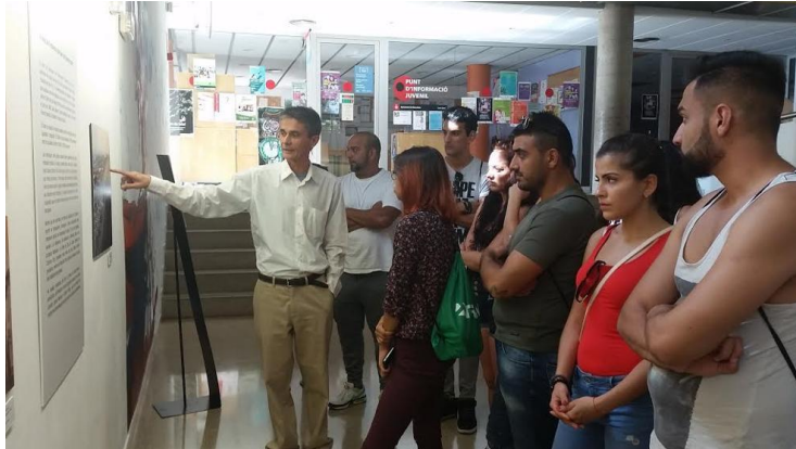
Jóvenes gitanos europeos visitan el Centre cívic del Besòs (Javier Torres)