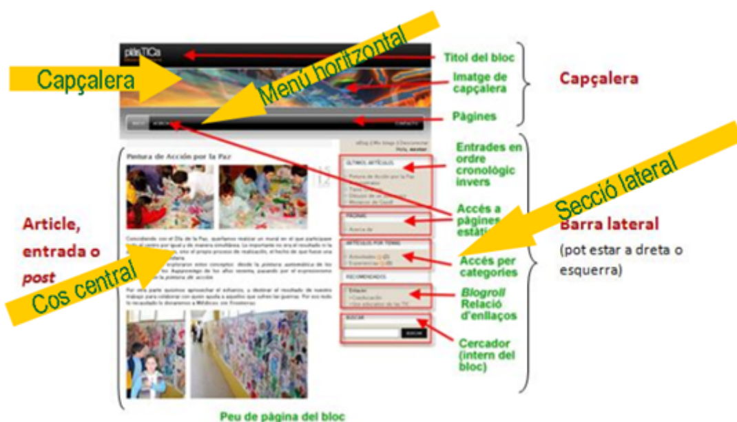
Estructura bàsica d'un blog

En un blog la informació, tant la fixa com la variable , se sol distribuir en aquests quatre espais: Capçalera, menú principal, cos central i seccions laterals.